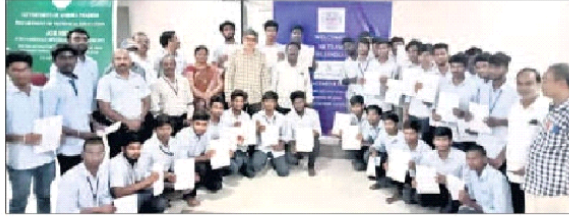
వీల్స్ ఇండియాలో శిక్షణకు ఎంపికైన విద్యార్థులు