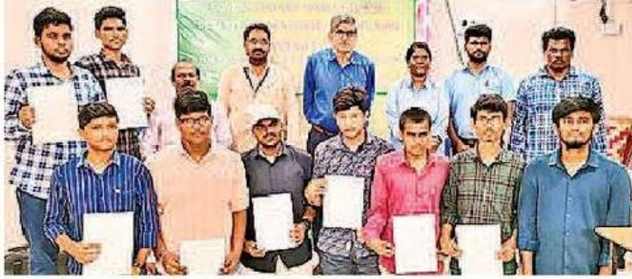
ఉద్యోగాలు సాధించిన వారితో కళాశాల ప్రతినిధులు